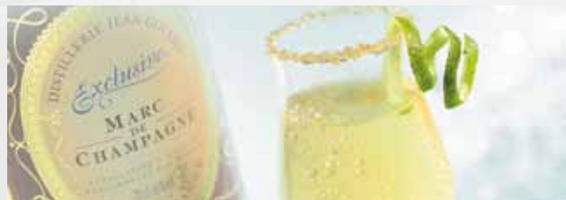
Marc Exclusive (40°) 3cl / Limonade à l'ancienne 5cl Un trait de jus de citron vert